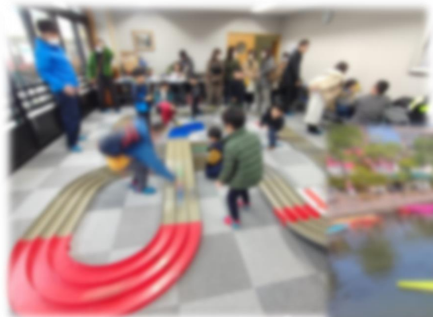
城西まつりでミニ四駆