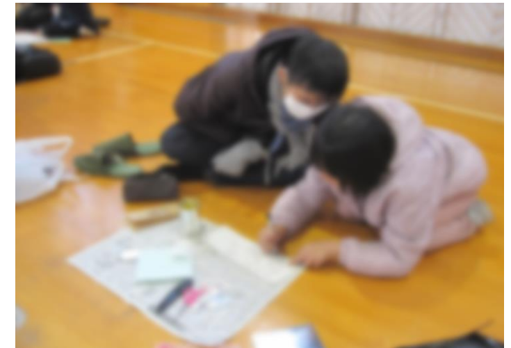
タイムカプセルに手紙を入れよう