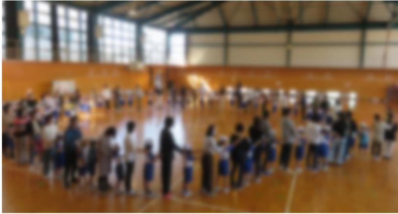
親子で元気に体を動かそう！