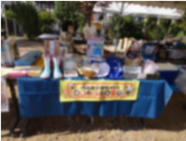
学用品バザーの様子