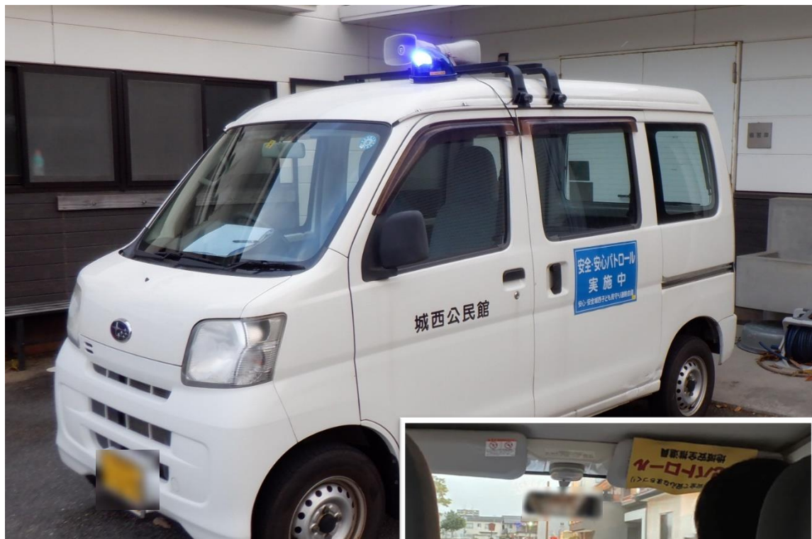
青色防犯パトロール車