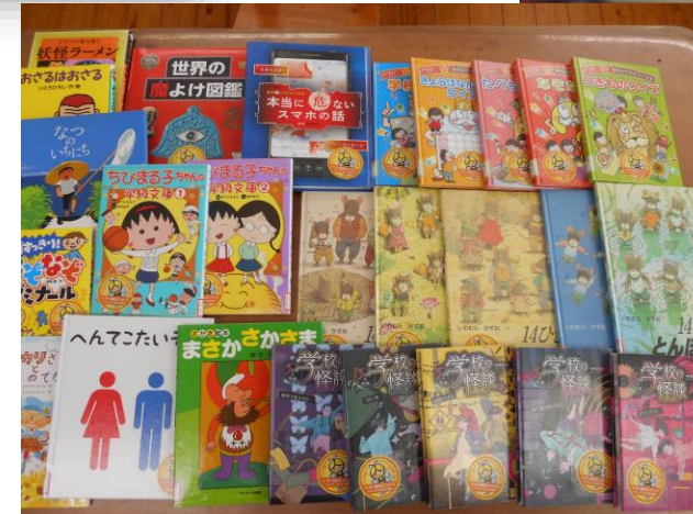
バザーの売り上げで図書館の本を購入しました