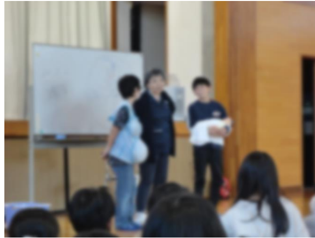
講演会（いのちとからだのはなし）