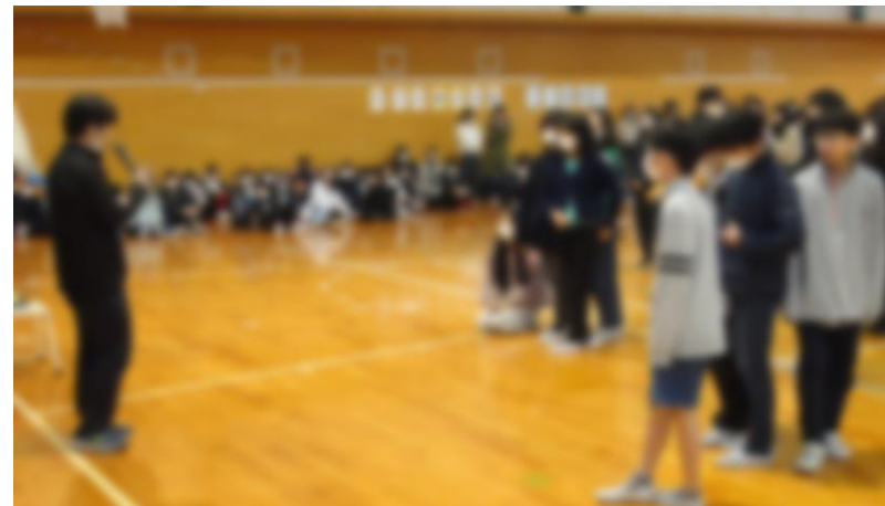
ミニ運動会（先生〇×クイズ）